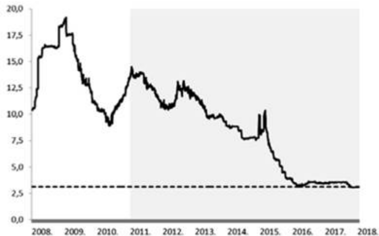
Grafikon 1. Kretanje zvaničnog srednjeg kursa dinara (prema evru)

Primer: kredit na 7 (sedam) godina indeksiran u evrima sa fiksnom kamatnom stopom