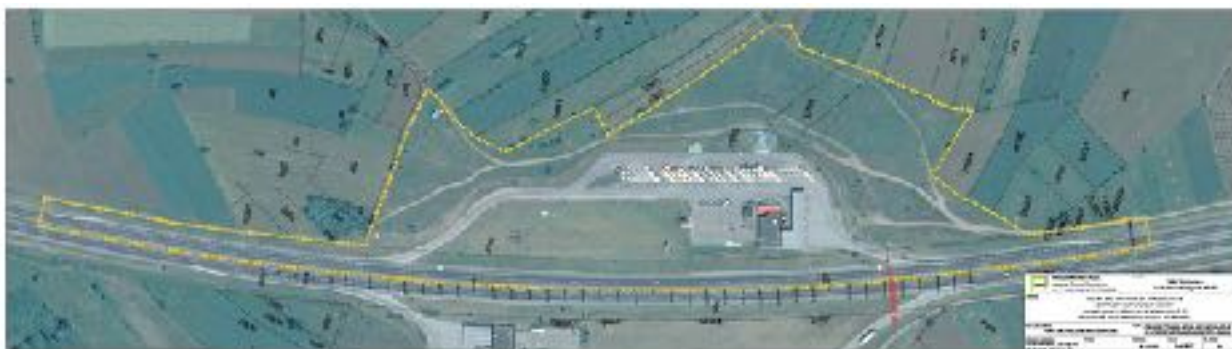
Слика 1.- Обухват ПДР-а на ортофото снимку

Граница и површина простора обухваћеног у анализи