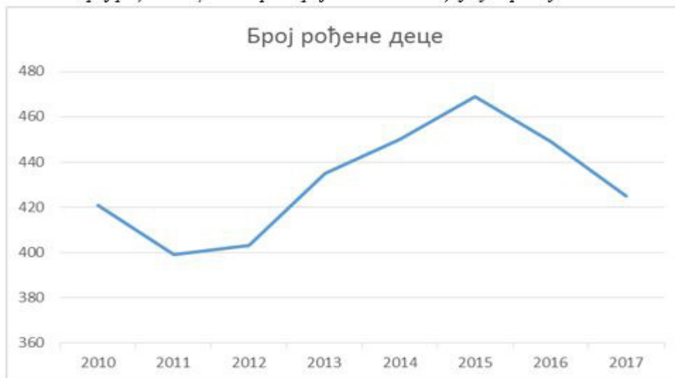
Слика 1. Број рођене деце на територији општине Инђија у периоду 2010-2017.

Просечан број деце рођене у периоду 2010-2017. година износи 431.