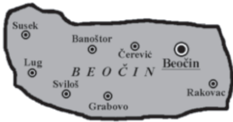
Слика 3: Насеља у општини Беочин

Просечна величина насеља је 23,3 км 2 . Територијално највеће катастарске општине су: Сусек (3.940,7 ха), Беочин (3505,6 ха) и Черевећ (3263,6 ха). Територијално најмање насеље је Луг, са површином од 996,5 ха. По броју становника највећа насеља су Беочин (8058), Черевећ (2826) и Раковац (1989 становника). Најмањи број становника има насеље Грабово, само 138 становника.