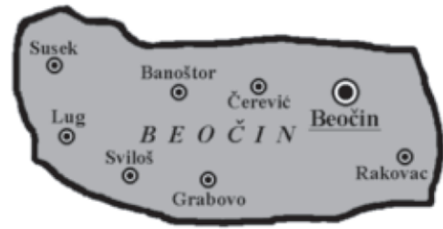
Слика 3: Насеља у општини Беочин, Извор: Архива ОУ Беочин

Просечна величина насеља је 23,3 км 2 . Територијално највеће катастарске општине су: Сусек (3.940,7 ха), Беочин (3505,6 ха) и Черевих (3263,6 ха). Територијално најмање насеље је Луг, са површином од 996,5 ха. По броју становника највећа насеља су Беочин (8058), Черевих (2826) и Раковац (1989 становника). Најмањи број становника има насеље Грабово, само 138 становника.