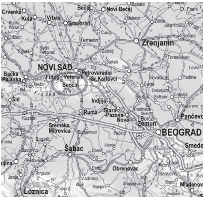
Слика 1: Беочин - положај, Извор: www.beocin.net