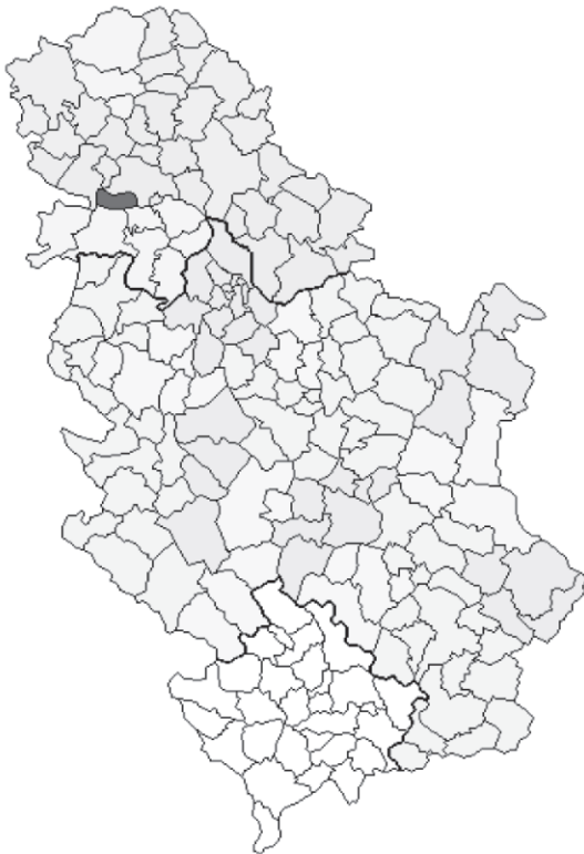
Слика 2: географска карта Србије са ознаком општине Беочин, Извор: Архива ОУ Беочин

На подручју општине Беочин има 8 насељених места: