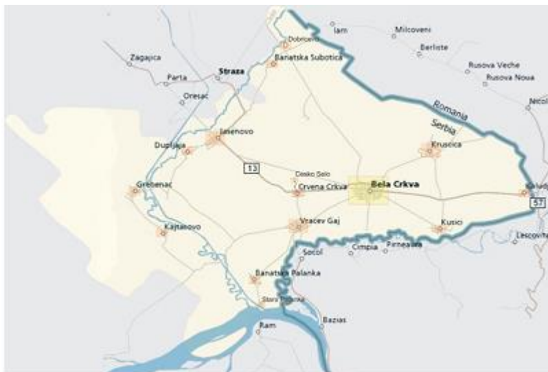
Слика 1. Мапа насеља општине Бела Црква

Иако има периферан положај у Србији, општина је саобраћајно веома добро повезана са суседним општинама. Саобраћајна повезаност огледа се у мрежи регионалних и магистралних путева, међународним граничним прелазом - Калуђерово, најстаријом железницом на Балкану из 1856. године, воденим саобраћајницама Дунавом, хидросистемом Дунав-Тиса-Дунав, као и аеродромом у Ц категорији. Добра саобраћајна повезаност са Вршцем, Ковином, Панчевом, Београдом и Смедеревом, као и гранични прелаз код Калуђерова доприносе да општина Бела Црква има повољан географски положај.