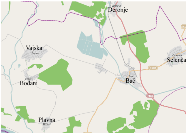
Слика 1: мапа Бача

Према степену развијености општина Бач спада у трећу групу недовољно развијених општина чији је степен развијености у распону од 60% до 80% републичког просека.